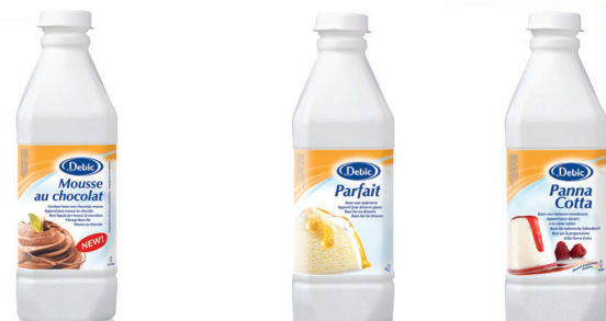
Mousse de Chocolate 3712 [6 x 1l] Parfait 3710 [6 x 1l] Panna Cotta 3713 [6 x 1l]