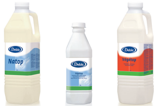
Natop (mix de nata) 3301 [6 x 2l] 3303 [1 x 10l] 3309 [1 x 1000l] Végétop (nata vegetal) 3304 [6 x 1l] 3308 [1 x 10l] Végétop azucarado (nata vegetal azucarada) 3310 [6 x 2l]