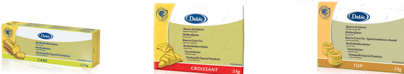
Mantequilla Cake con caroteno 3506 [4 x 2,5kg] Mantequilla Croissant con caroteno 3507 [5 x 2kg] Mantequilla Top con caroteno 3502 [5 x 2kg]