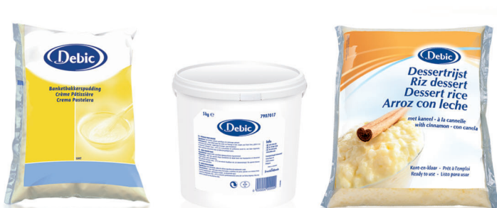
Crema Pastelera 4101 [6 x 1,75kg] Queso Quark 4001 [1 x 5kg] Arroz con leche 3701 [4 x 2,5kg]