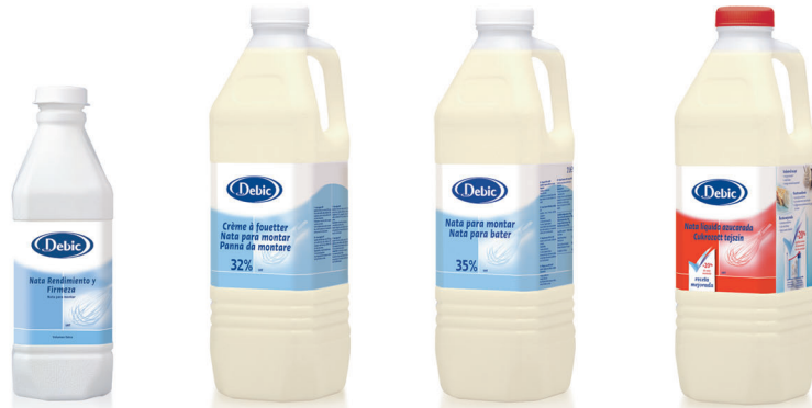
Nata rendimiento y firmeza 35% M.G. 3002 [6 x 1l] 3006 [3 x 5l] Nata líquida 32% M.G. 3004 [6 x 2l] Nata líquida 35% M.G. 3003 [6 x 2l] Nata líquida azucarada 35% M.G. 3001 [6 x 2l]