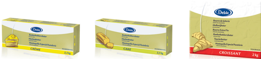
Mantequilla Creme Standard 3508 [4 x 2,5kg] Mantequilla Cake Standard 3503 [4 x 2,5kg] Mantequilla Croissant Standard 3504 [5 x 2kg]